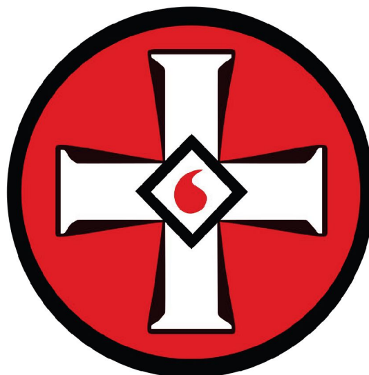
Рисунок 1. Эмблема ультраправой организации «Ку-клукс-клан»