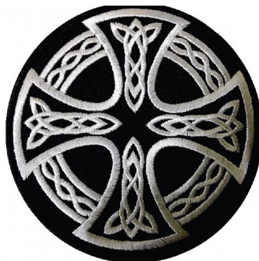
Рисунок 2. Кельтский крест. Символ многих расистских организаций